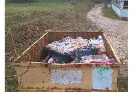
Benne avec éléments en fibro ciment cassés