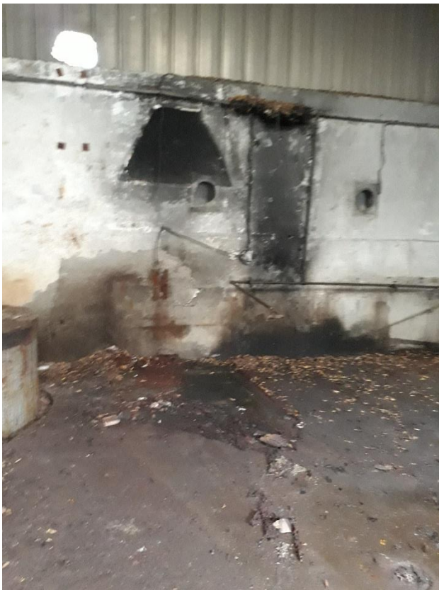
Pièce arrière forge enlevée