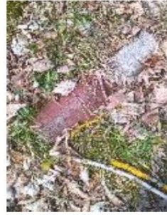
Eléments en fibro ciment